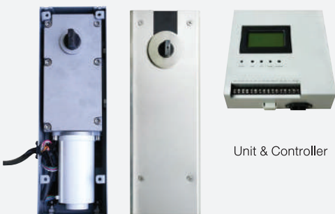
Unit & Controller